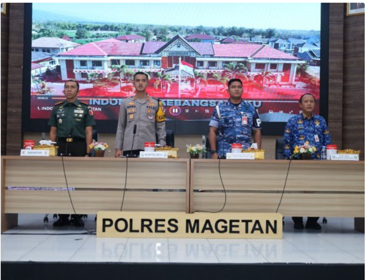
Dandim 0804/Magetan Hadiri Rakor Lintas Sektoral kesiapan operasi lilin 2024

Magetan. – Guna meningkatkan Sinergitas dalam rangka kesiapan operasi lilin 2024 pengamanan Hari Raya Natal 2024 dan Tahun Baru 2025 di wilayah Kabupaten Magetan yang aman dan kondusif.