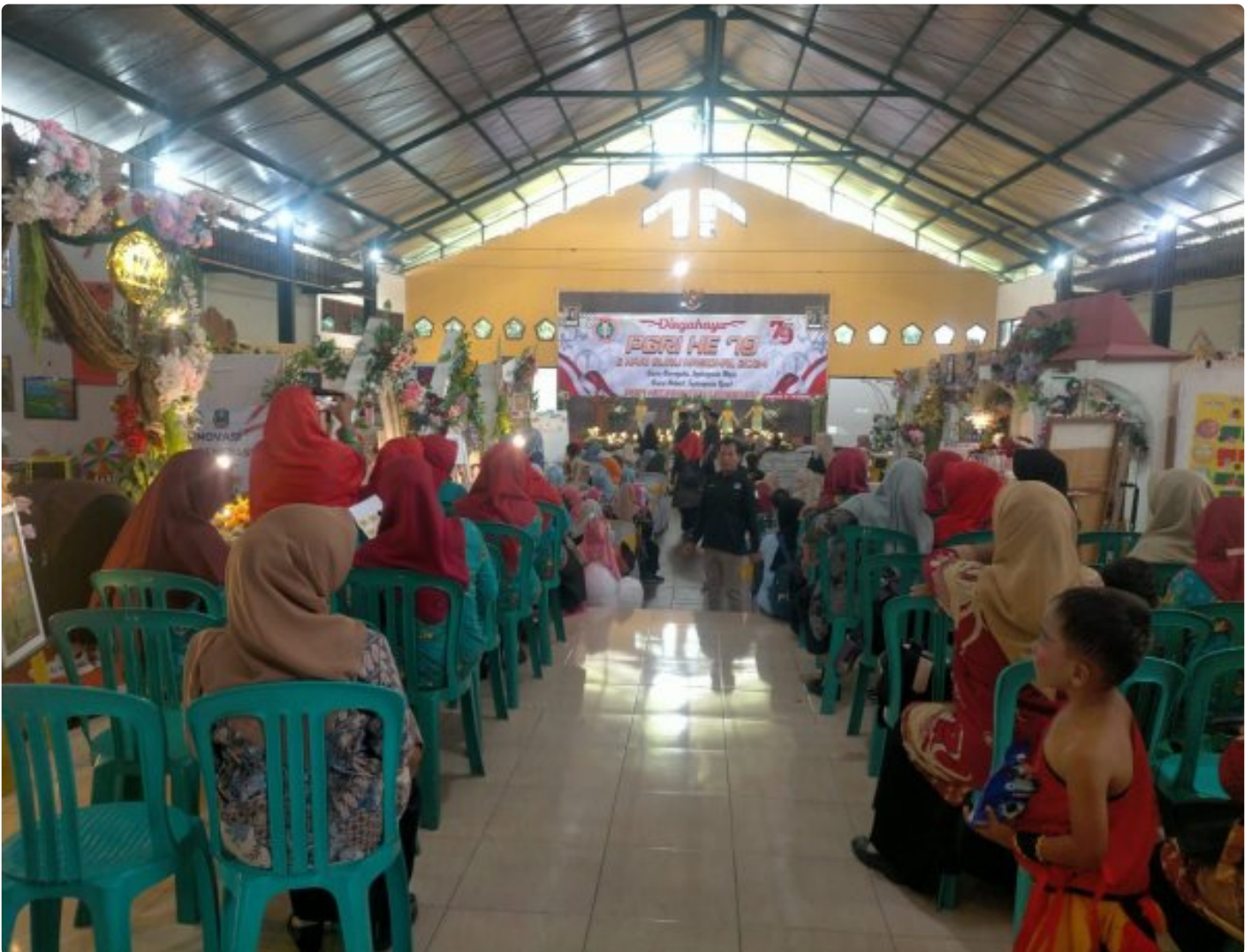
Danramil 0804/12 Lembeyan Hadiri HUT PGRI Ke-79 Dan Hari Guru Nasional (HGN) Se Kecamatan Lembeyan Tahun 2024